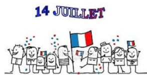
la fête nationale