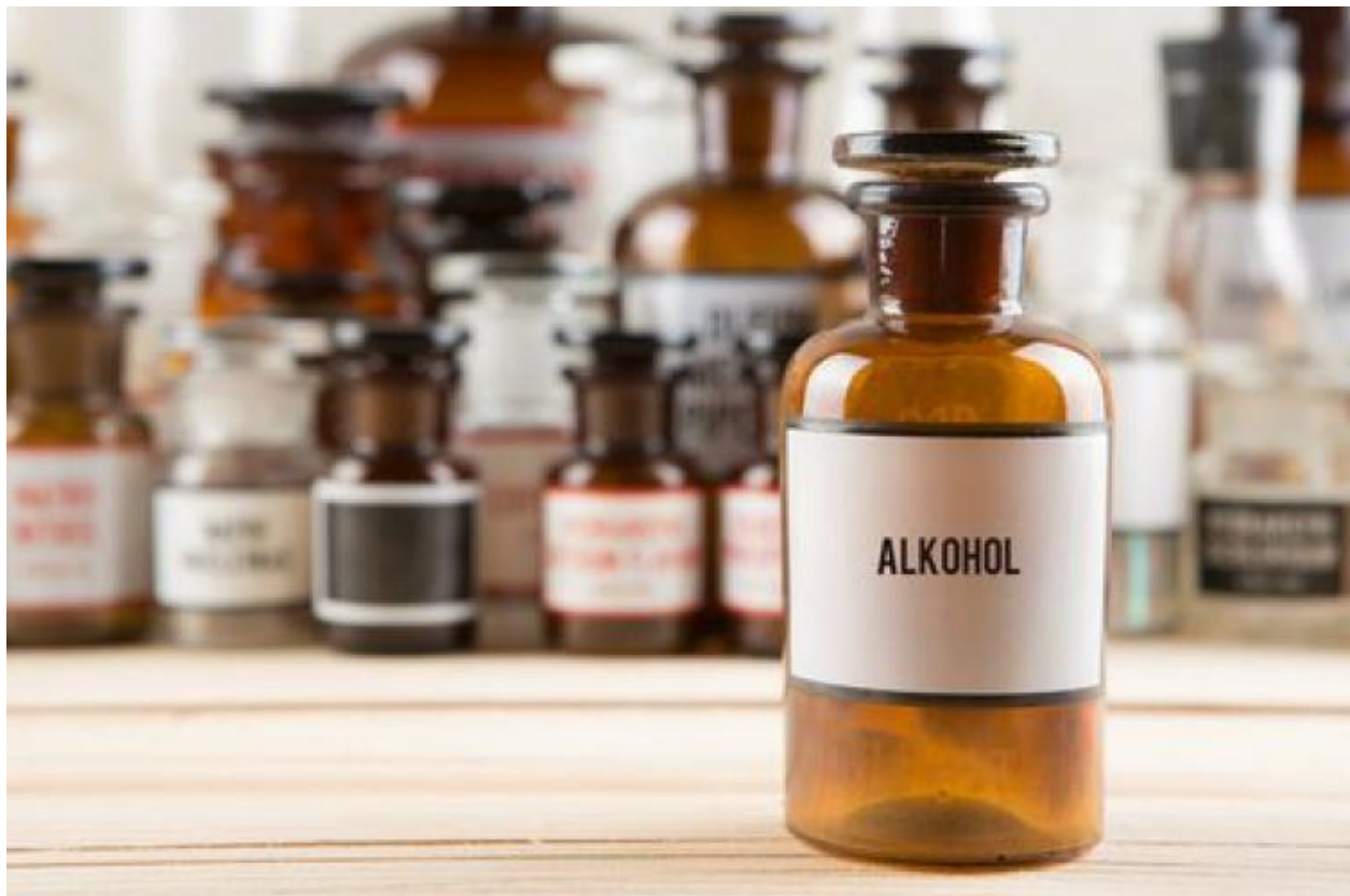
Слика бр. 1 – медицински алкохол који се употребљава за дезинфекцију

Алкохол – добија се из шећера који се налази у воћу и житарицама. Главни је састојак неких пића као што су вино, пиво итд. У нешто другачијем облику алкохол се користи за дезинфекцију, чишћење радних површина итд.