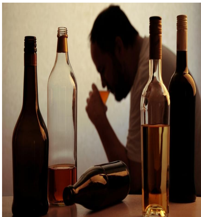
Слика бр. 3 – Штетно дејство алкохола