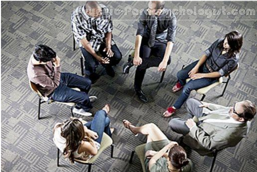
Слика бр. 4 – Групна терапија

Лечење особа зависних од конзумирања алкохола – под надзором уз помоћ лекара и психолога, најбоље у болницама, али постоје и групе које се баве пружању подршке особама које су решиле да престану да конзумирају алкохол.