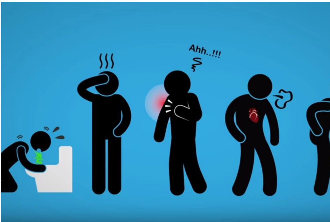
Слика бр. 2 – Последице и стања након конзумирања алкохола

У већим количинама конзумирање алкохола доводи до: