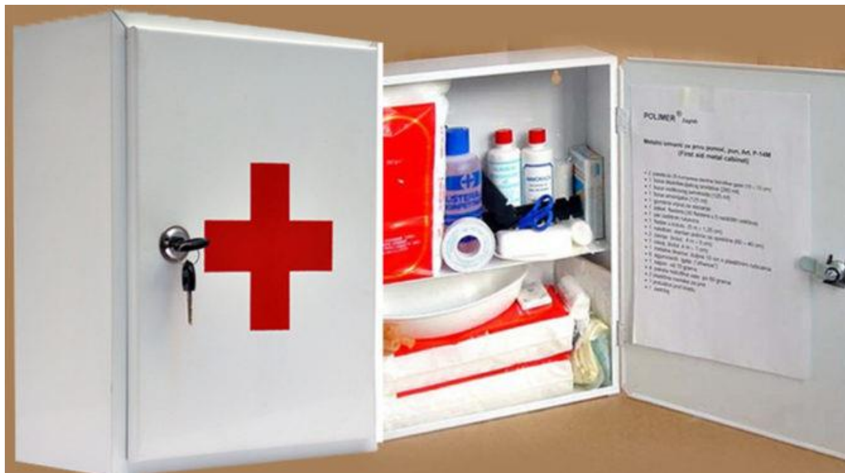
Слика бр. 1 – Опрема за прву помоћ

Опрема за прву помоћ – сет за пружање прве помоћи. Састоји се од газе, завоја, фластера, пластичних рукавица итд. Налази се најчешће у белим зидним ормарићима са цреним крстом на вратима.