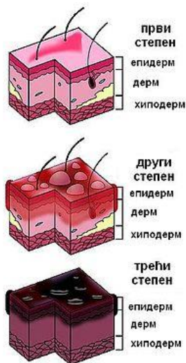
Слика бр. 2 – Типови опекотина