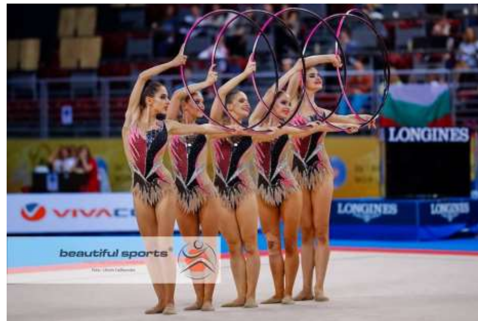
Reprezentacija Srbije na Svetskom prvenstvu Ritmicke gimnastike 2018.